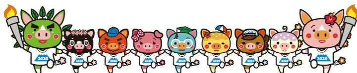
燃ゆる感動かごしま国体・大会マスコット「ぐりぶーファミリー」