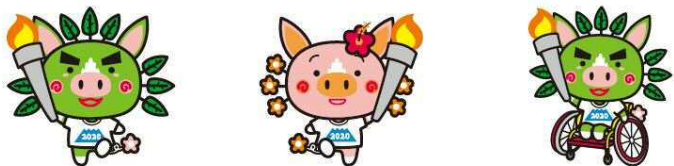
燃ゆる感動かごしま国体マスコット ぐりぶーファミリー「ぐりぶー」