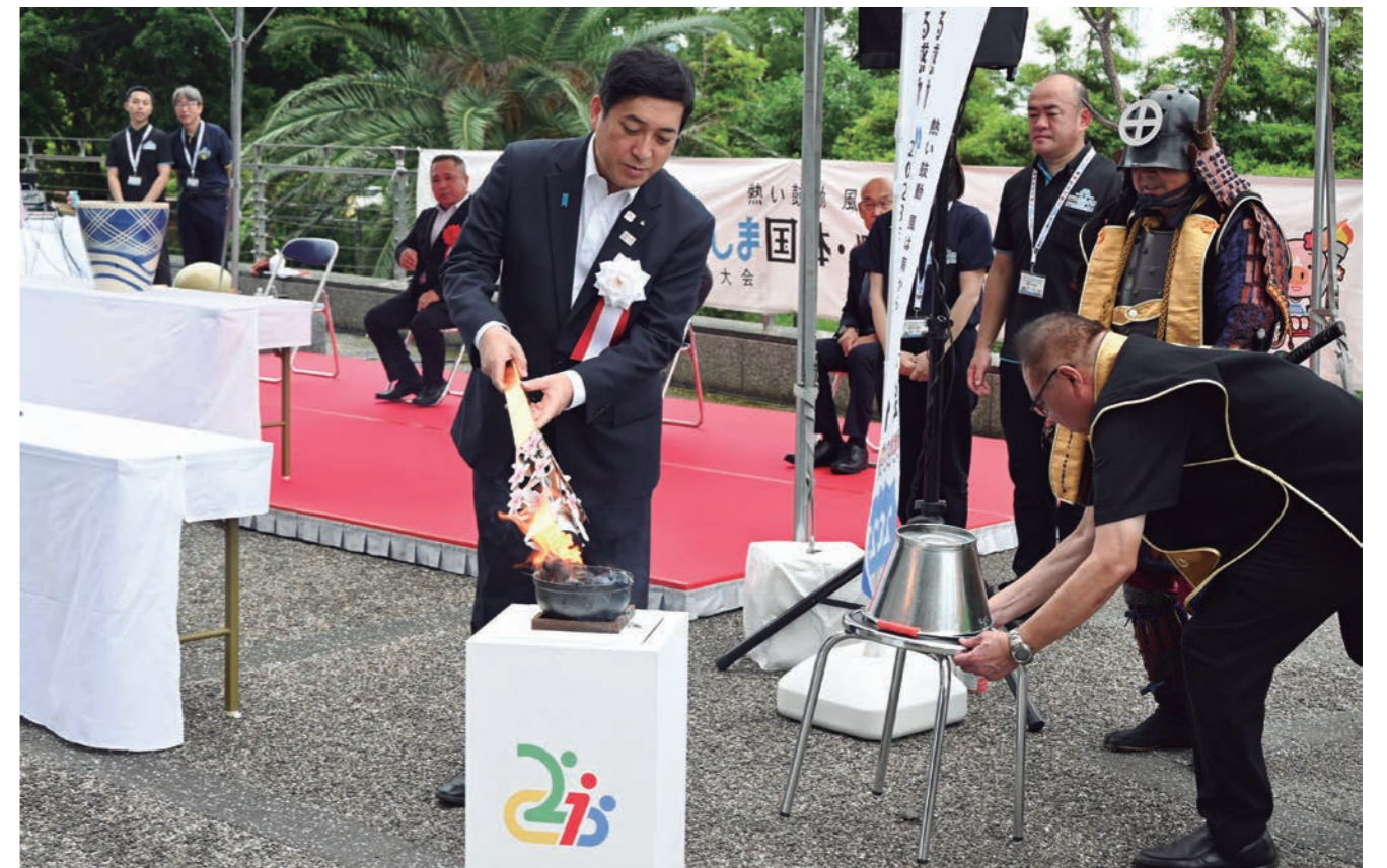
採火式で、火打石で起こした火を炬火トーチに移す塩田康一鹿児島県知事