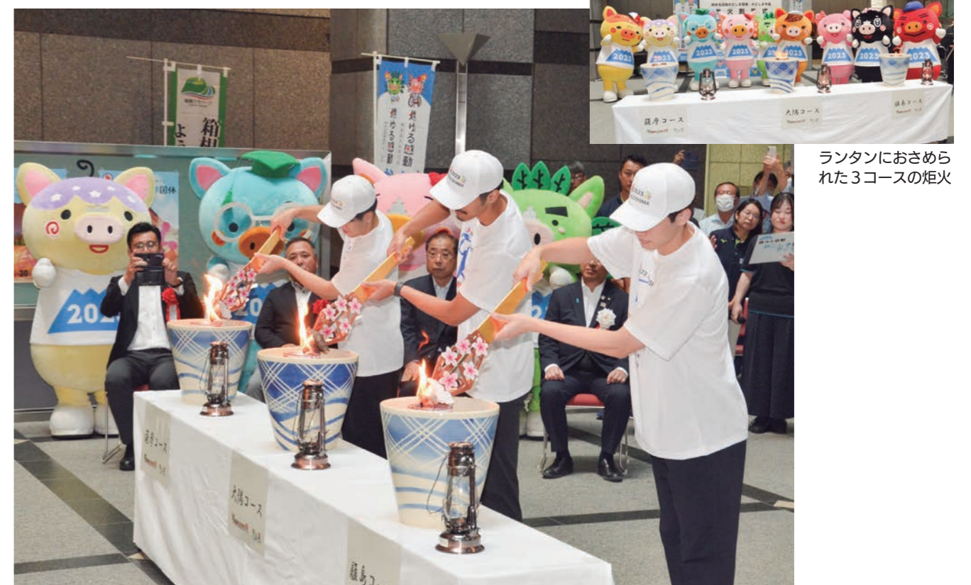
ランタンにおさまられた3コースの炬火