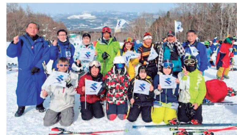
スキー競技に出場した鹿兒島県の選手たち