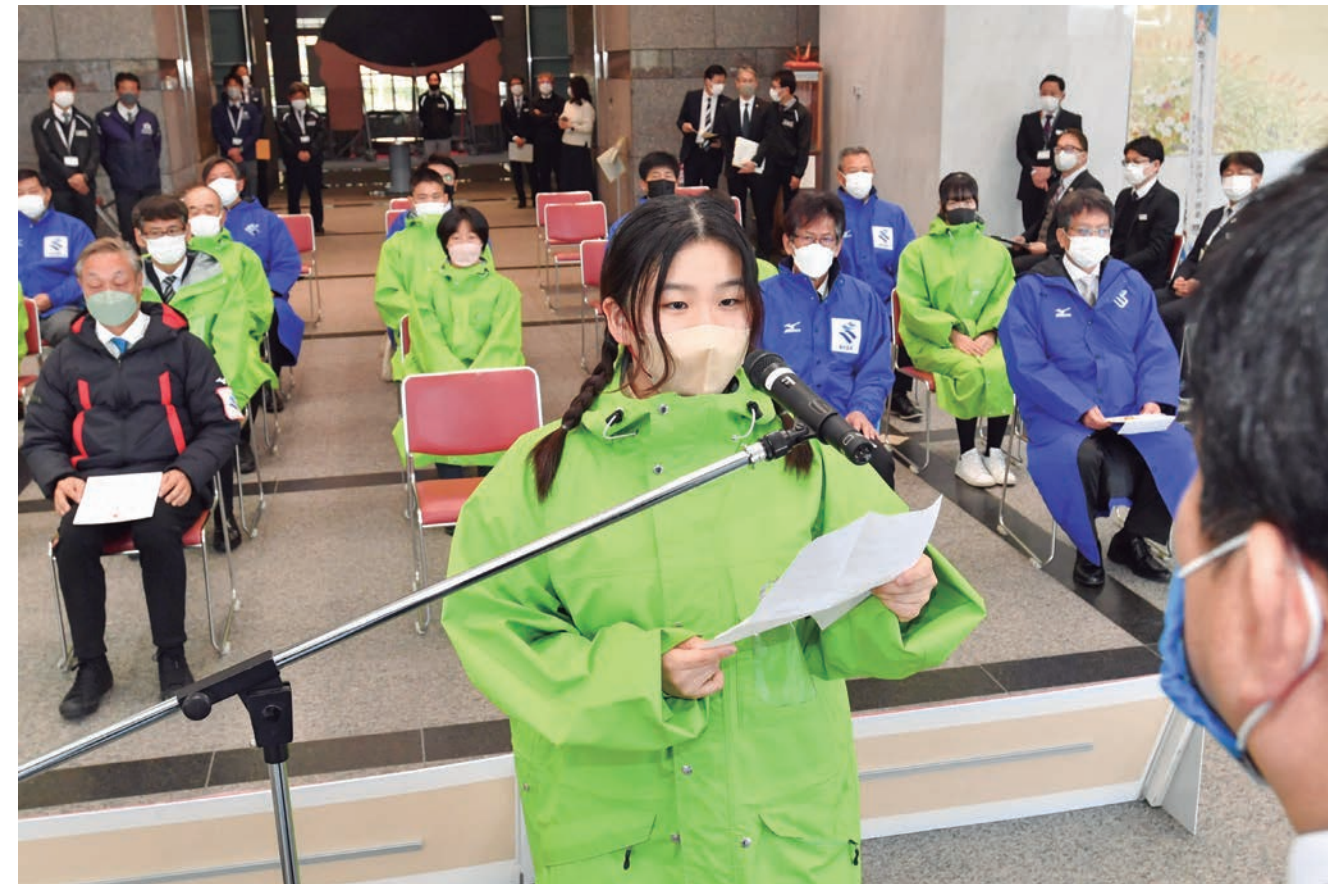
冬季大会に出場する鹿児島県選手団の結団式(1月18日、鹿児島県庁)

特別国民体育大会の冬季大会スケート競技会は1月28日～2月2日まで、アイスホッケー競技会は2月1日～5日まで共に青森県で、スキー競技会は2月17日～20日まで岩手県で開催されました。