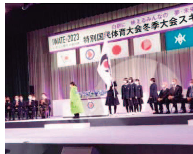
冬季大会スキー競技会の開始式