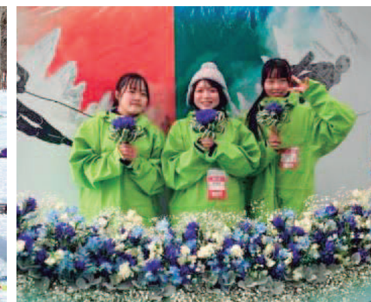
開始式会場で記念撮影する鹿兒島県選手