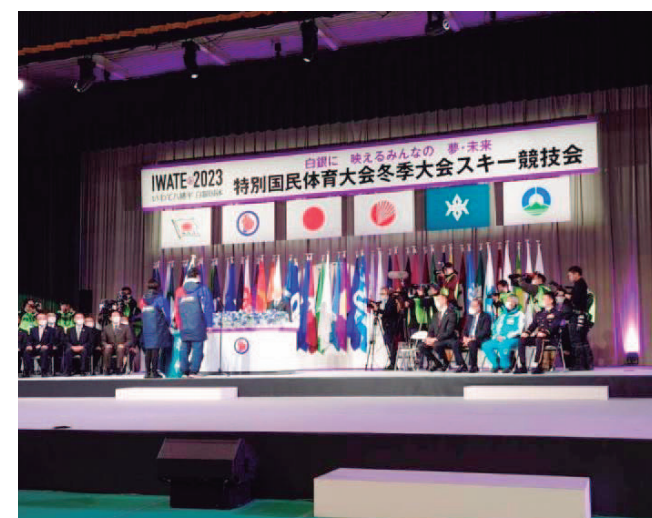
冬季大会スキー競技会の開始式(2月17日、岩手県の八幡平市総合運動公園体育館)