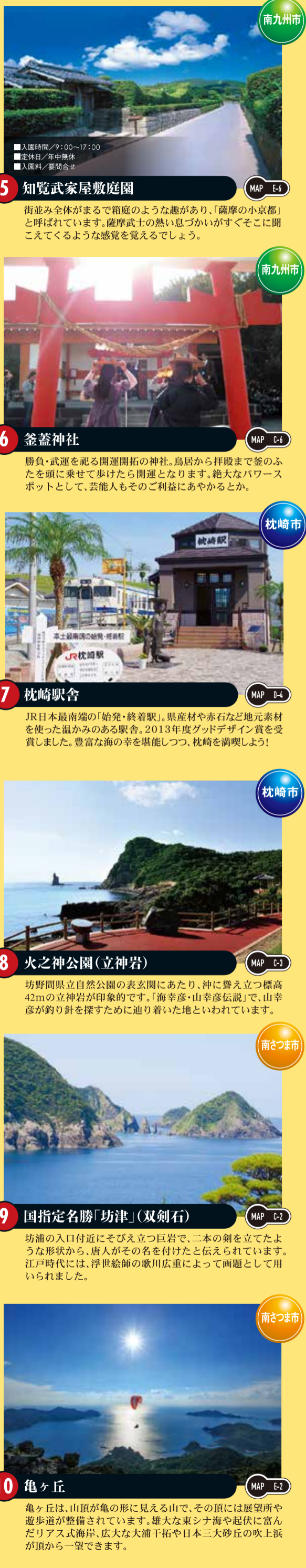
10 亀ヶ丘 亀ヶ丘は、山頂が亀の形に見える山で、その頂には展望台や遊歩道が整備されています。雄大な東シナ海や起伏に富んだリアス式海岸、広大な大浦干拓や日本三大砂丘の吹上浜が頂から一望できます。