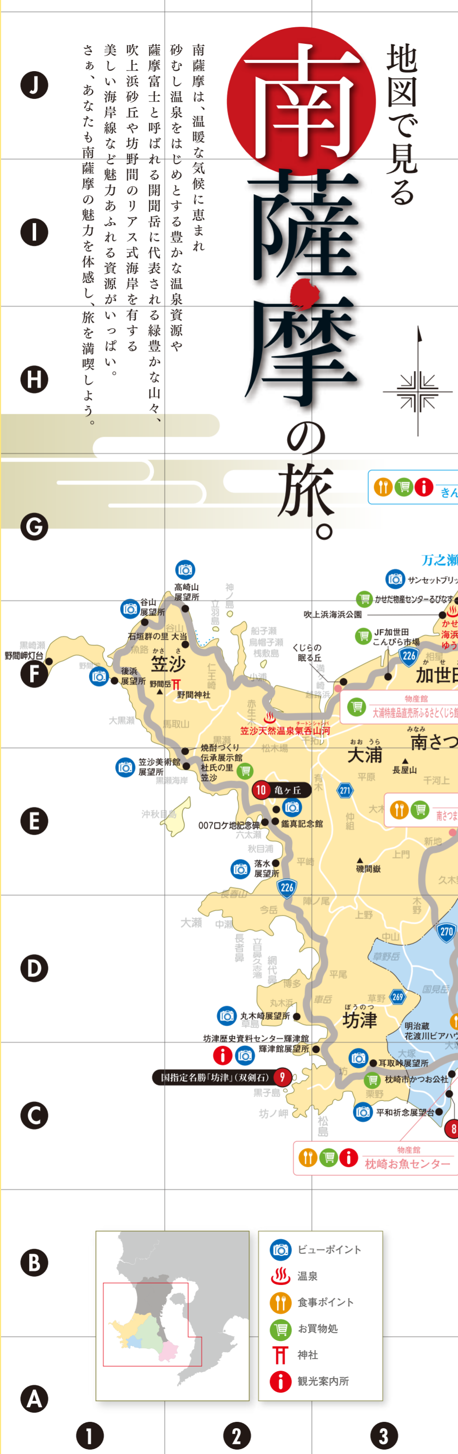
南九州市 南九州市 南九州市

地図で見る 南薩摩は、温暖な気候に恵まれ砂むし温泉をはじめとする豊かな温泉資源や薩摩富士と呼ばれる開聞岳に代表される緑豊かな山々、吹上浜砂丘や坊野間のリアス式海岸を有する美しい海岸線など魅力あふれる資源がいっぱい。さあ、あなたも南薩摩の魅力を体感し、旅を満喫しよう。