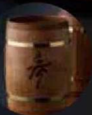
文字や図柄を焼き付けてオリジナルのビアジョッキに

「豪快にビールを飲みたい!!」というお客様のご要望から誕生したジョッキ。本体には霧島山系産の本桜、取手及び上下のアクセントにウォールナットを使用。[シリアルNO.入り]