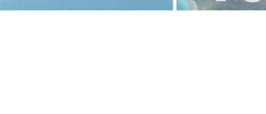
小ノホシ海岸の 洞(小ノホシ) 海岸に突き出た岩の間にできた洞窟。海苔干しをする平