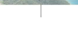
ハートが 見える風景(諸島)