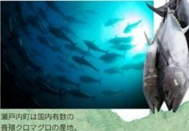
瀬戸内町は国内有数の養殖タロマゴの産地。