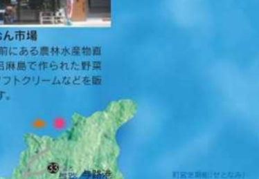
ハミヤ島 諸島と与路島の間に横たわる白い砂浜が美しい無人島。