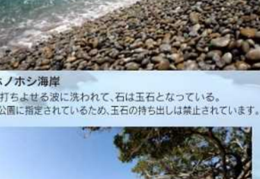
ホノホシ海岸 長く打ち寄せる波に洗われて、石は玉石となっている。国立公園に指定されているため、玉石の持ち出しは禁止されています。