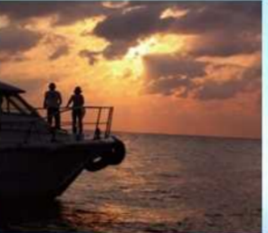
感動のサンセットクルージング