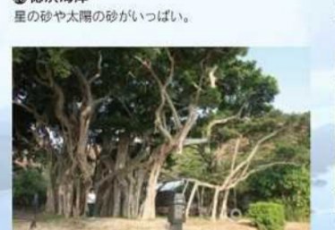
徳浜海岸 星の砂や太陽の影が美しい。