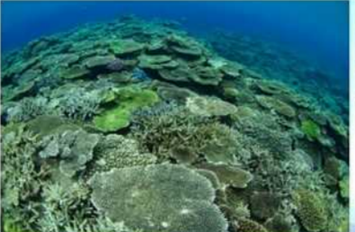
熱帯魚気分で気軽にシュノーケリング&ダイビング 海岸線が複雑で、潮の流れがよく、透明度抜群の大島海峡は、ダイビングのメッカ