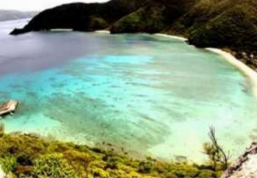
実久海岸 半島形のマヘ真珠も購入可。

ゆるやかな時が流れる加計呂麻島は、奄美大島の南部に大島海峡をはさんで位置する面積77.25km 2 、人口約1,000人の島。複雑なリアス式の入り江に縁取られ、良港をもつことから、琉球と大和の文化が交錯する。また明治時代より、海軍の要塞として知られ、戦跡が多く残っている。 ※加計呂麻島での所要時間は、時速30km(1km当たり2分/レンタカー利用の場合)で計算してください。