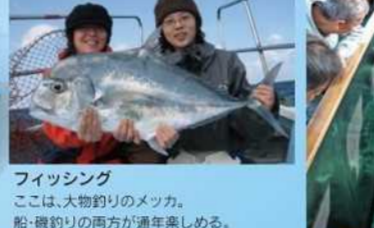
フィッシング ここは、大物釣りのメッカ。船・磯釣りの両方が通年楽しめる。