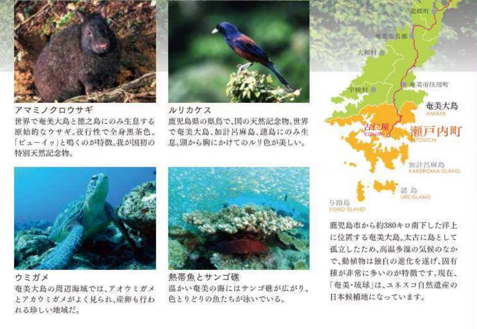
アマミノクロウサギ... ルリカケス... ウミガメ... 熱帯魚とサンゴ礁...