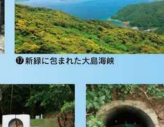
新緑に包まれた大島海峡