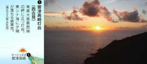
三連立神とティゴ(西古見) 冬には海に近いティゴ(西古見)が、海に沈む夕日に照らされ、神秘的な雰囲気を醸成する。また、この時期は、奄美大島の海が、澄み渡るように美しく、透明度抜群の大島海峡は、ダイビングのメッカ