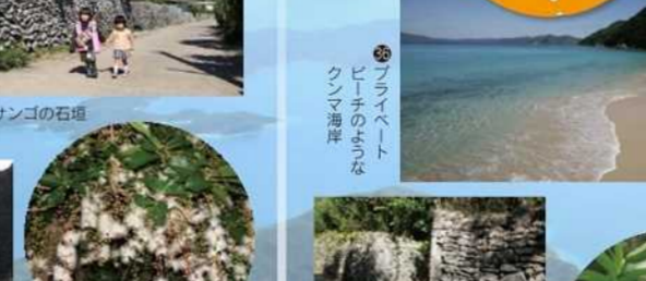
島の宝100景(諸島) 涼を呼ぶサンゴの石垣