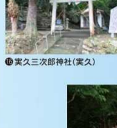
実久三次郎神社(実久)