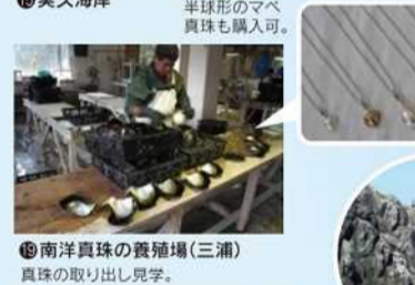
南洋真珠の養殖場(三浦) 真珠の取り出し見学。(奄美サウスシー&マペール(古仁屋) ☎0997-72-4061/水曜定休・要予約)