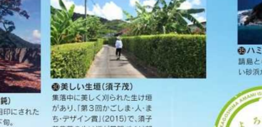
美しい生垣(須子茂) 集落中に美しく刈られた生け垣があり、[第3回かごしま・まちデザイン賞](2015)で、須子茂集落の生け垣が「琉球づくり部門」の優秀賞に選ばれた。