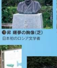
日本文学者の銅像(芝) 日本初のロシア文学者