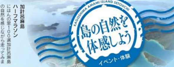
島の自然を体感しよう イベント・体験