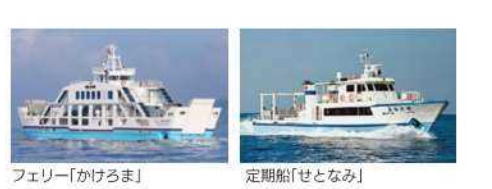
フェリー「けけるま」 定期船「せとなみ」