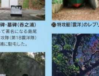
島尾敏雄文学碑・墓碑(吾之浦) 後に純文学者として著名になる島尾敏雄は、戦中、特攻隊(第18戦隊)指揮官として吾之浦に駐屯した。