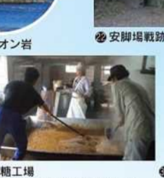
製糖工場 期間中(1~4月)、運がよければ出来たての新糖が味わえるかも。