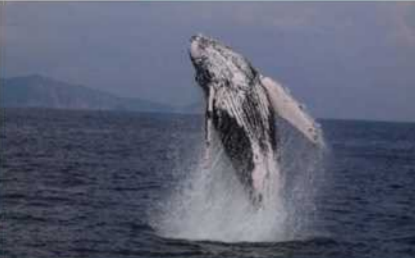
ホエールウォッチング 6~11月ごろまで北太平洋でたっぷり餌を食べたサトウウチラは葉巻を目的に、秋に奄美大島や沖縄などに南下する。1月~3月までホエールウォッチングツアーあり。