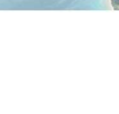
ニ又岩(クマクティル) 獅子舞のシンボルで守り神。轟音を立てて流れていたこの音を真人神が白羽扇を振って、止まらせたという伝承がある。