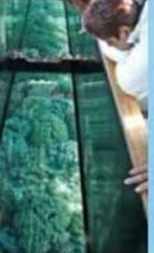
グラスボートゆうぐう ☎0997-72-4584 要予約。