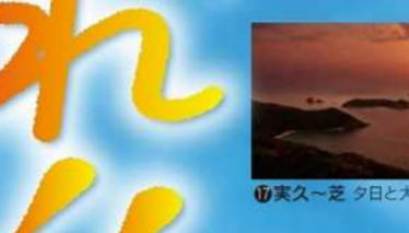
実久〜夕日と大島海峡