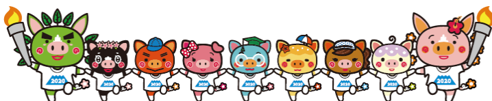
燃ゆる感動かごしま国体・大会マスコット「ぐりぶーファミリー」