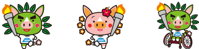
燃ゆる感動かごしま国体マスコット ぐりぶーファミリー「ぐりぶー」